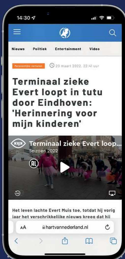
Hart van Nederland